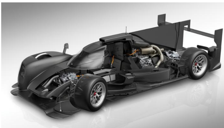
Extremer Leichtbau zeichnet den Porsche 919 Hybrid aus

Umgerechnet auf die 13,629 Kilometer lange Strecke von Le Mans, sie ist der Maßstab für das Reglement, beträgt die zur Verfügung stehende elektrische Energie 2,22 Kilowattstunden. Das entspricht acht Megajoule und damit der höchsten Energieklasse, die das Reglement vorsieht. Porsche war 2015 der erste und einzige Hersteller, der sich so weit vorwagte. 2016 tritt auch Toyota in der Acht-Megajoule-Klasse an. Audi beschränkt sich auf sechs Megajoule. Das WEC-Reglement gleicht diese Unterschiede nahezu aus.