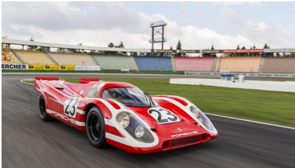
Der Porsche 917 auf der Rennstrecke

Insgesamt baute Porsche 65 Exemplare des 917: 44 Sportwagen als Kurz- und Langheck-Coupés, zwei PA Spyder sowie 19 Sportwagen als CanAm- und Interserie-Spyder mit bis zu 1.400 PS starken Turbomotoren. Typisch Porsche: Die für diese Rennen entwickelten Technologien zur Leistungssteigerung wurden erfolgreich auf die Straßensportwagen übertragen. So machte der abgasseitig geregelte Turbolader ab 1974 im 911 Turbo Karriere und ist seit dieser Zeit ein Inbegriff für die Leistungsfähigkeit von Porsche-Sportwagen.