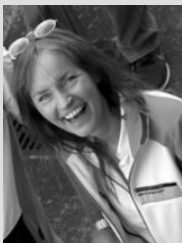
Illustration: design hoch drei, Porsche Engineering

Text erstmalig erschienen im Porsche-Kundenmagazin Christophorus, Nr. 395.