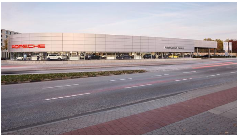
Porsche Zentrum Hamburg, 2019, Porsche AG

„Porsche Drive“ im Porsche Zentrum Hamburg in der Lübecker Straße können sie an einem zentralen Standort Porsche Fahrzeuge mieten – und das in einem zeitlich sehr flexiblen Rahmen.“