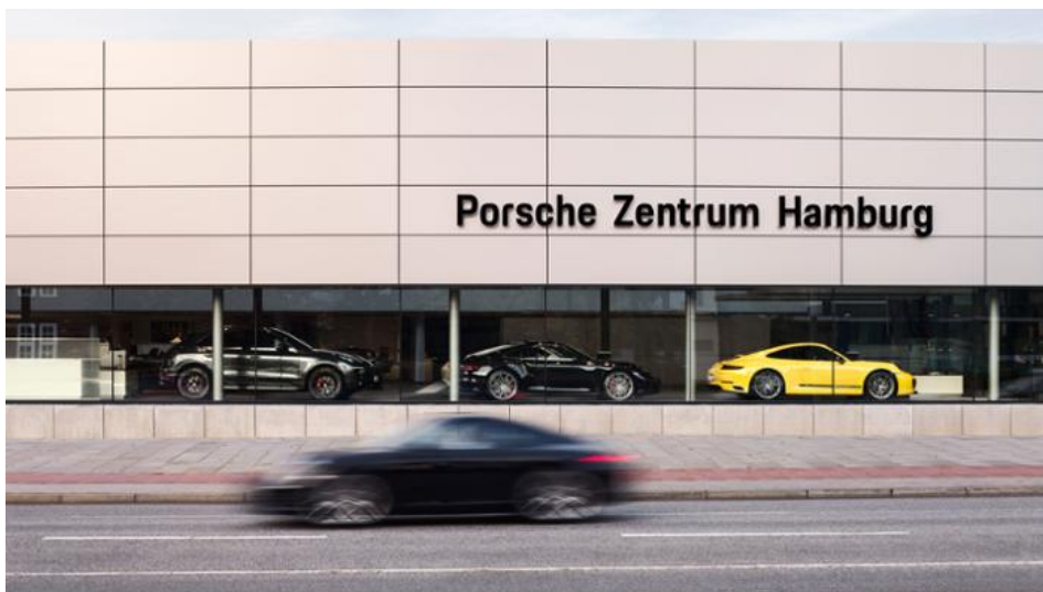
Porsche Zentrum Hamburg, 2019, Porsche AG

„Porsche Drive“ bietet Kunden in Hamburg, Stuttgart, Berlin und auf Sylt die Möglichkeit, aktuelle Porsche Fahrzeuge zu mieten – und das für bis zu 28 Tage. Im Fuhrpark sind ausgewählte Modellreihen verfügbar, darunter auch der neue 911. Die Abwicklung in Hamburg erfolgt direkt am Porsche Zentrum an der Alster.