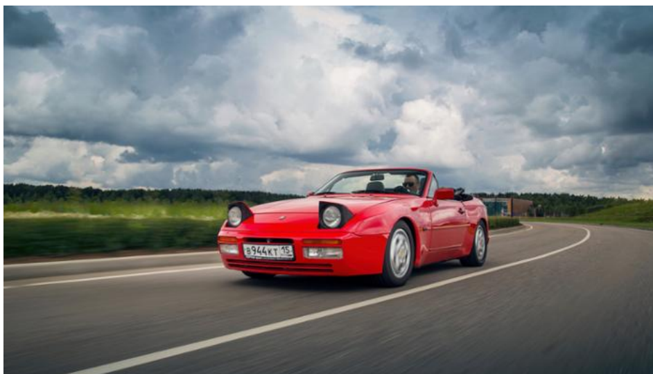
Porsche 944, Москва, 2019, Porsche AG

Основной проблемой было состояние двигателя, который не держал холостой ход. Пришлось заказывать некоторые компоненты, приводить в порядок проводку. Теперь этот вопрос решен, мотор работает отлично. Дальше мы изучили ходовую часть: кое-какие элементы поменяли, некоторые отреставрировали. Автомобиль имел неплохой внешний вид, но мы все же поработали над передней частью: покрасили и отрегулировали зазоры у кузовных элементов.