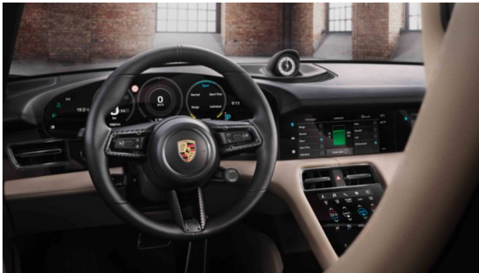
Интерьер Taycan Turbo от Porsche Exclusive Manufaktur