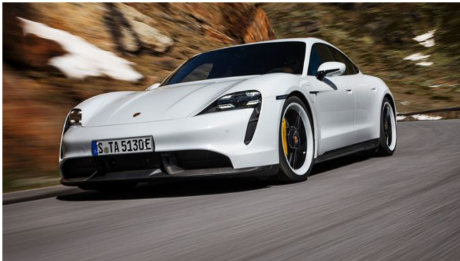
Новый Porsche Taycan

12-дневная постоянная программа Porsche на стенде