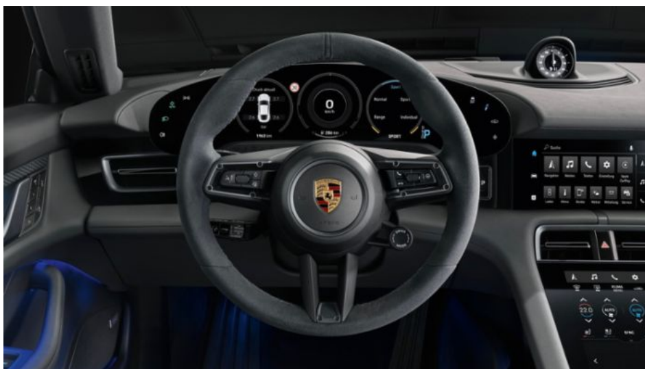
Интерьер нового Porsche Taycan 4S

Базовая комплектация Taycan 4S предусматривает частичную кожаную отделку салона и комфортные передние сиденья с 8-позиционной электрорегулировкой.