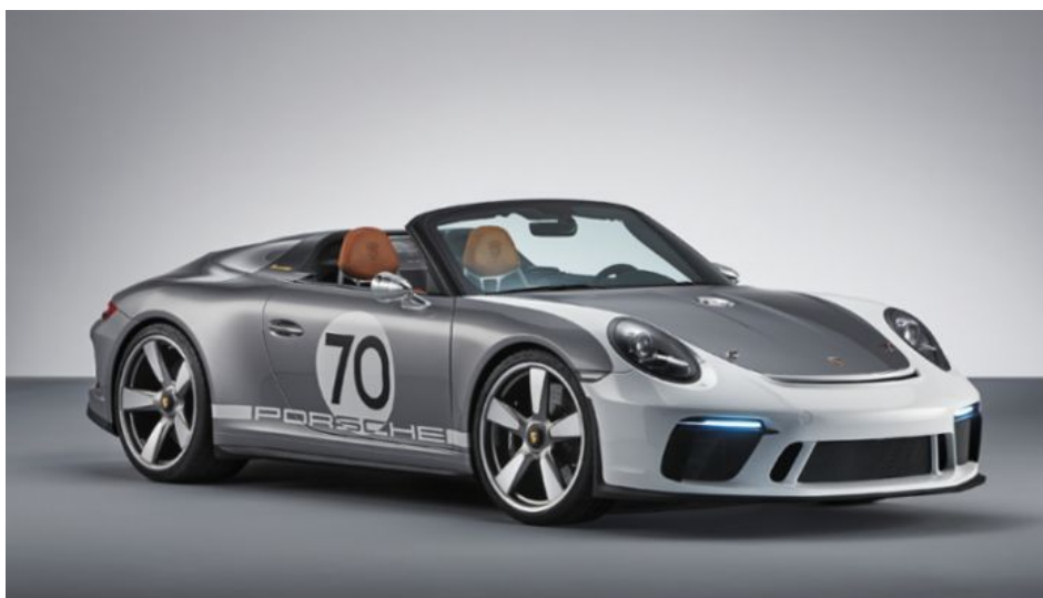
Концепт 911 Speedster, 2018, Porsche AG

В 2018 году компания Porsche подготовила для себя, возможно, самый лучший подарок: 911 Speedster Concept – концепт открытого и особо экспрессивного спортивного автомобиля готового к эксплуатации по дорогам. Новая модель отпраздновала мировую премьеру в Цуффенхаузене, посвященную 70-летию юбилею спортивных автомобилей Porsche. Уникальный автомобиль, представленный в версии Heritage, является своеобразным мостом между современностью и 1948 годом, когда профессор Фердинанд Порше основал свое предприятие и молодая марка добилась первых успехов в автоспорте благодаря легким вариантам Speedster модели Porsche 356.