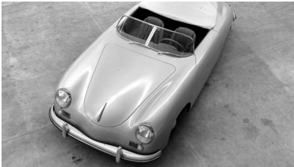
356 Speedster, модель 1954 года, Porsche AG

Позднее появились и другие поколения 356 Speedster. Модель достигла своего апогея в 1957 году с выходом 356 A 1500 GS Carrera GT Speedster. Его двигатель с вертикальными валами и рабочим объемом 1,5 литра развивал 110 л.с. Это была первая серийная модель Porsche, которая развивала максимальную скорость 200 км/ч.