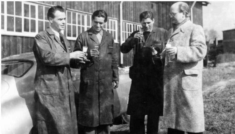
The first factory collection in 1950