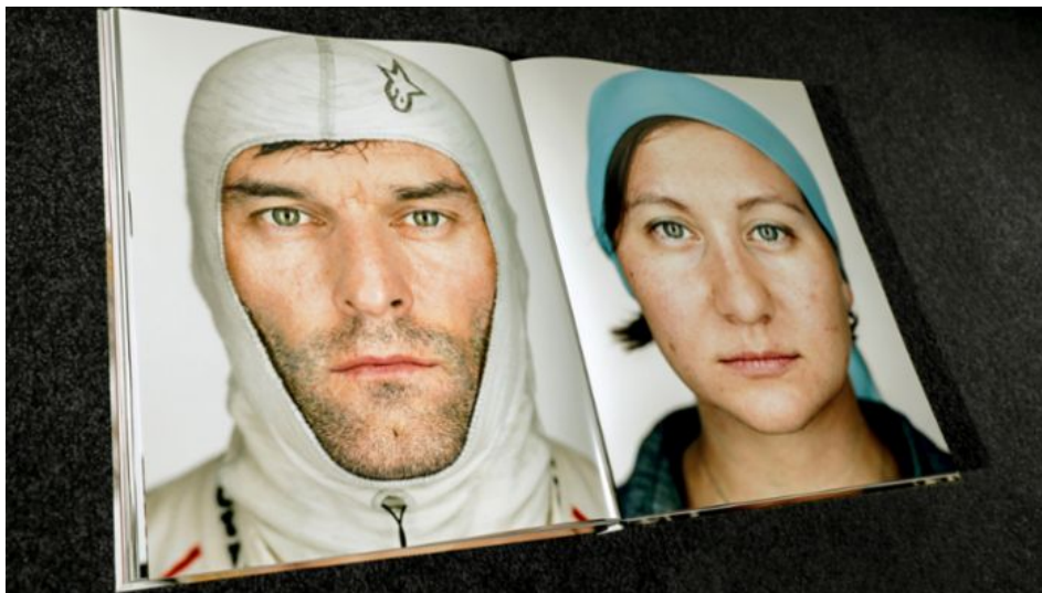
Nah, näher, Close: Mark Webber mit Sturm-maske im aktuellen Bildband „Close“ von Martin Schoeller

Eine der Fotografien von damals landete nun auch im neuen Bildband „Close“. Dort ist ein Portrait von Porsche-Markenbotschafter Mark Webber aus dem Shooting von 2016 abgebildet. Der Rennfahrer hat noch immer die Sturmmaske auf und blickt konzentriert in die Kamera. Damit ist Webber in einer Reihe mit Prominenten wie Barack Obama, Taylor Swift oder Lionel Messi abgebildet.