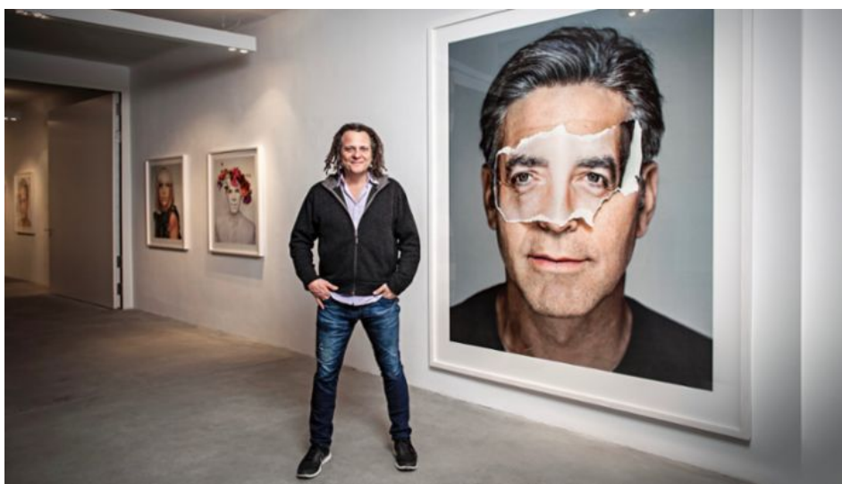
Martin Schoeller vor seinem Porträt von George Clooney

Oder Schoeller schafft es nicht, das Posing seines Gegenübers zu durchbrechen: „George Clooney ist so ein Kandidat. Der ist immer höflich, lustig, macht alles mit, aber eine halbwegs ehrliche Sekunde habe ich bei ihm noch nie erwischt. Weil er das Posieren nicht lassen kann.“ Bei einem Shooting mit Hollywoods Charmeur hat Schoeller Clooney überrascht. Er hat eines seiner früheren Porträts von Clooney genommen, die Partie zwischen Nase und Stirn herausgerissen, ein Gummiband daran befestigt und dem Schauspieler wie eine Maske vors Gesicht geschoben. Clooney fand es witzig, so fotografiert zu werden. Das Bild (siehe Seite 4) ging um die Welt. In seinem verblüffend simplen Ministudio mit den schwarzen Vorhängen saßen neben diversen Hollywood-Stars auch Taylor Swift, Justin Timberlake und Iggy Pop. Oder Politiker wie Barack Obama, Hillary Clinton und Angela Merkel. Schoeller weiß, was Macht mit dem Minenspiel macht.