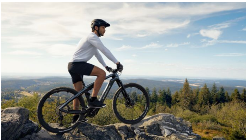
Porsche eBike Cross.

La Porsche eBike Cross da lo mejor de sí en el campo, fuera de los caminos fáciles y lejos de las carreteras. El potente motor, recientemente desarrollado por Shimano, demuestra su capacidad en los terrenos más complicados y ofrece grandes prestaciones, con una entrega de potencia agradable. Los frenos de alto rendimiento Magura-MT Trail aguantan muy bien la fatiga y cuentan con discos de gran tamaño que garantizan unas detenciones óptimas. El sistema mecánico de cambio Shimano XT de 12 velocidades permite subir y bajar marchas de manera rápida y eficaz.