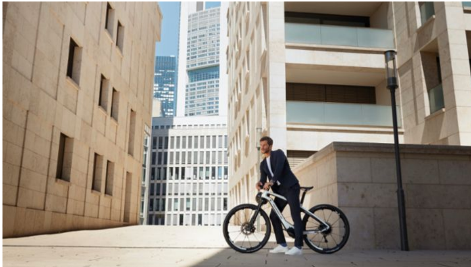
Porsche eBike Sport.

Forma y función van de la mano en algunos elementos como los frenos de alto rendimiento Magura con manetas en el manillar, o las luces LED M99 del especialista en iluminación Supernova, que están integradas en la potencia del manillar y en la tija del sillín aerodinámico. Además, los componentes de suspensión de alta calidad, como la horquilla invertida Magura y el amortiguador trasero Fox, en combinación con los neumáticos de carretera, logran una conducción deportiva y equilibrada sobre asfalto o pistas suaves.