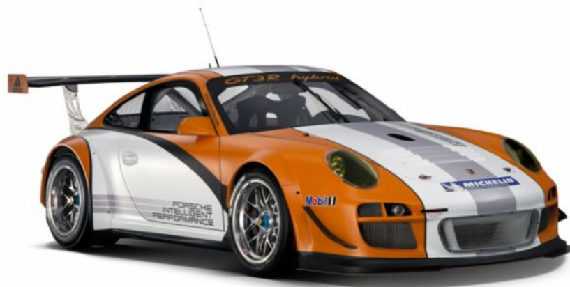
Der 911 GT3 R Hybrid von 2010

Mit dem Rennwagen mit elektrischem Vorderachsenantrieb und Schwungradspeicher setzt Porsche erstmals auf Hybridantrieb im Motorsport. Technische Daten: Verbrennungsmotor 353 kW (480 PS), Elektromotor 2 x 60 kW (81 PS)