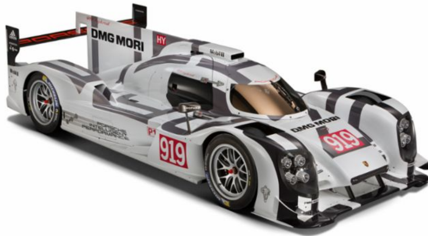
Der Porsche 919 Hybrid von 2014

Mit dem komplexesten Rennwagen aller Zeiten gewinnt Porsche 2015–2017 jeweils die Langstrecken-WM in Fahrer- und Teamwertung. Technische Daten: Verbrenner 370 kW (503 PS), Elektromotor 184 kW (250 PS)