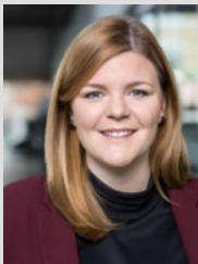
Illustration: Design Hoch Drei