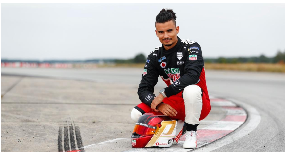
Pascal Wehrlein, pilote TAG Heuer Porsche Formula E Team

Les modèles historiques et iconiques de course et de route ne seront pas les seuls à diffuser leur son typique Porsche dans les salons du monde entier. En effet, des véhicules phares qui ont fait plus récemment les grandes heures de la marque en course automobile seront également mis en scène. En effet, les voitures de course à motorisation électrique constituent aujourd'hui un maillon essentiel dans la stratégie de l'entreprise. Le pilote de Formule E Pascal Wehrlein s'élancera ainsi au volant de sa 99X Electric sur la piste d'essai de Weissach. Avec la Porsche 99X Electric, le TAG Heuer Porsche Formula E Team 2021 célèbre sa deuxième saison en Formule E. A ce titre, la Formula E Porsche entre donc dans la liste des voitures de sport qui écrivent l'histoire de la marque.