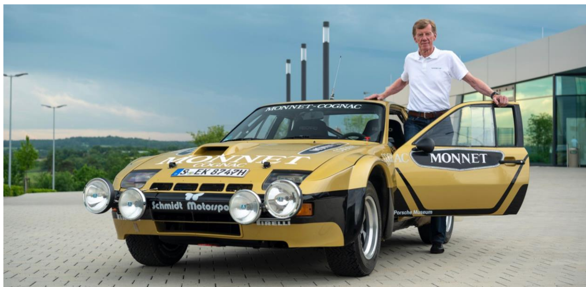
Walter Röhrl, 924 Carrera GTS Rallye

la 962 C portant le numéro 17 dont la PDK fut améliorée, avant d'obtenir le titre de champion à la fin de la saison. Les fans du monde entier pourront également se réjouir de la présence du double champion du monde de rallye, Walter Röhrl. Ce dernier présentera la 924 Carrera GTS Rallye, avec laquelle il a remporté quatre victoires au Championnat d'Allemagne des rallyes en 1981. Au début de l'année, à l'occasion du 40e anniversaire de la saison de rallye 1981, le département Porsche Heritage and Museum a fait la surprise à Walter Röhrl en lui présentant une 924 « Monnet » fraîchement restaurée dans sa livrée originale noire et or.