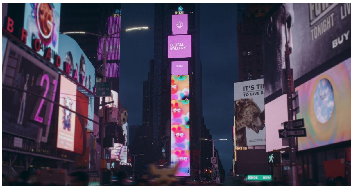
Global Gallery à New York City.

cours des prochains mois, d'autres activités "Dreamers. On." seront ajoutées à une plateforme dédiée en ligne. Les agences de communication Proximity et PHD soutiennent Porsche dans ce projet.