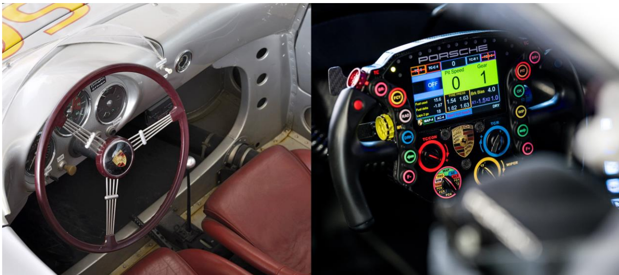
De la 550 Spyder (1954) à la 911 RSR (2019)

Pour en savoir plus et obtenir des vidéos et photographies d'illustration, rendez-vous sur la Newsroom Porsche : newsroom.porsche.com . La chaîne Twitter @PorscheRaces diffuse les actualités Porsche Motorsport en direct des circuits du monde entier.